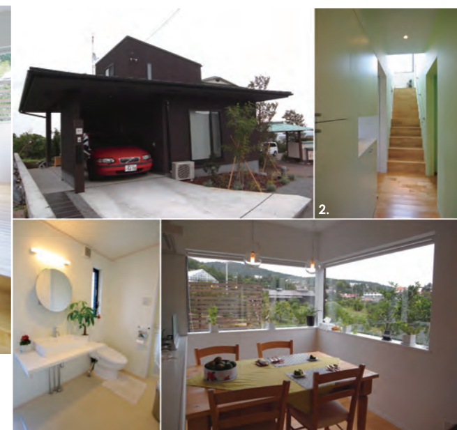
1. LDK の写真。小さめだが品格漂うオリジナルワインセラー。人が中に入れる大きさで、ワイン以外の収納にも活躍している。 2. 玄関から、2階の階段まで右側の壁面だけをグリーンでペイント。清々しさと強弱をもたらす効果がある。