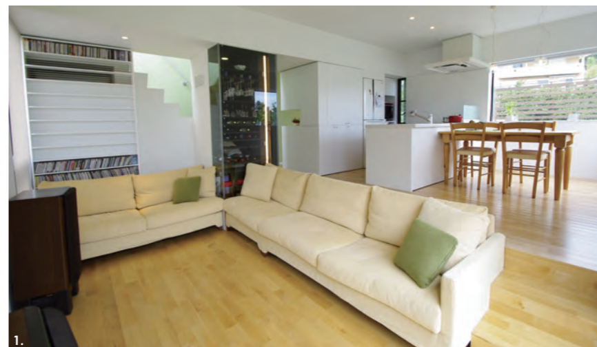
「小さいお家がいいの」

そんなご要望からプランの打ち合わせは始まった。極力コンパクトにまとめ、一見平屋にも見えるお住まいがこのたび完成した。