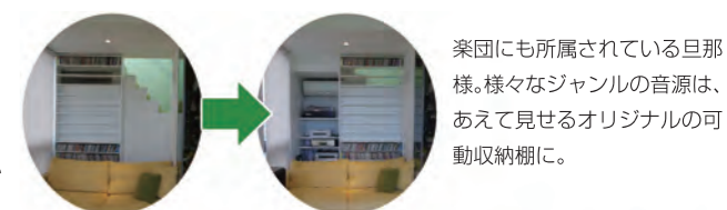
楽団にも所属されている旦那様。様々なジャンルの音源は、あえて見せるオリジナルの可動収納棚に。