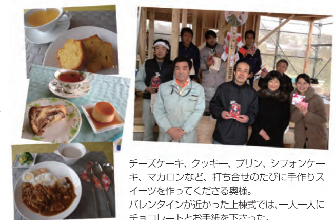
チーズケーキ、クッキー、プリン、シフォンケーキ、マカロンなど、打ち合せのたびに手作りスイーツを作ってくださいました奥様。バレンタインが近かった上様式では、一人一人にチョコレートとお手紙を下された。