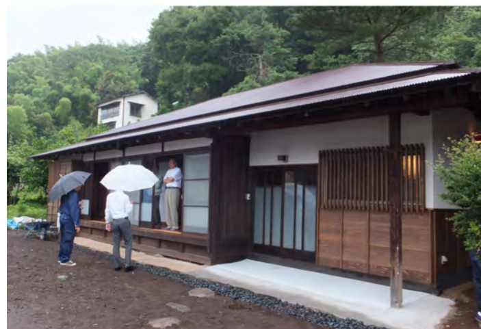
1. 竹の花瓶 現場監督が家主にプレゼント 2. 家主とセトケン社員。囲炉裏を囲んで、美味しい食事と会話で楽しい夜 3. 庭にシンボルツリーの植樹、今後の成長が楽しみ