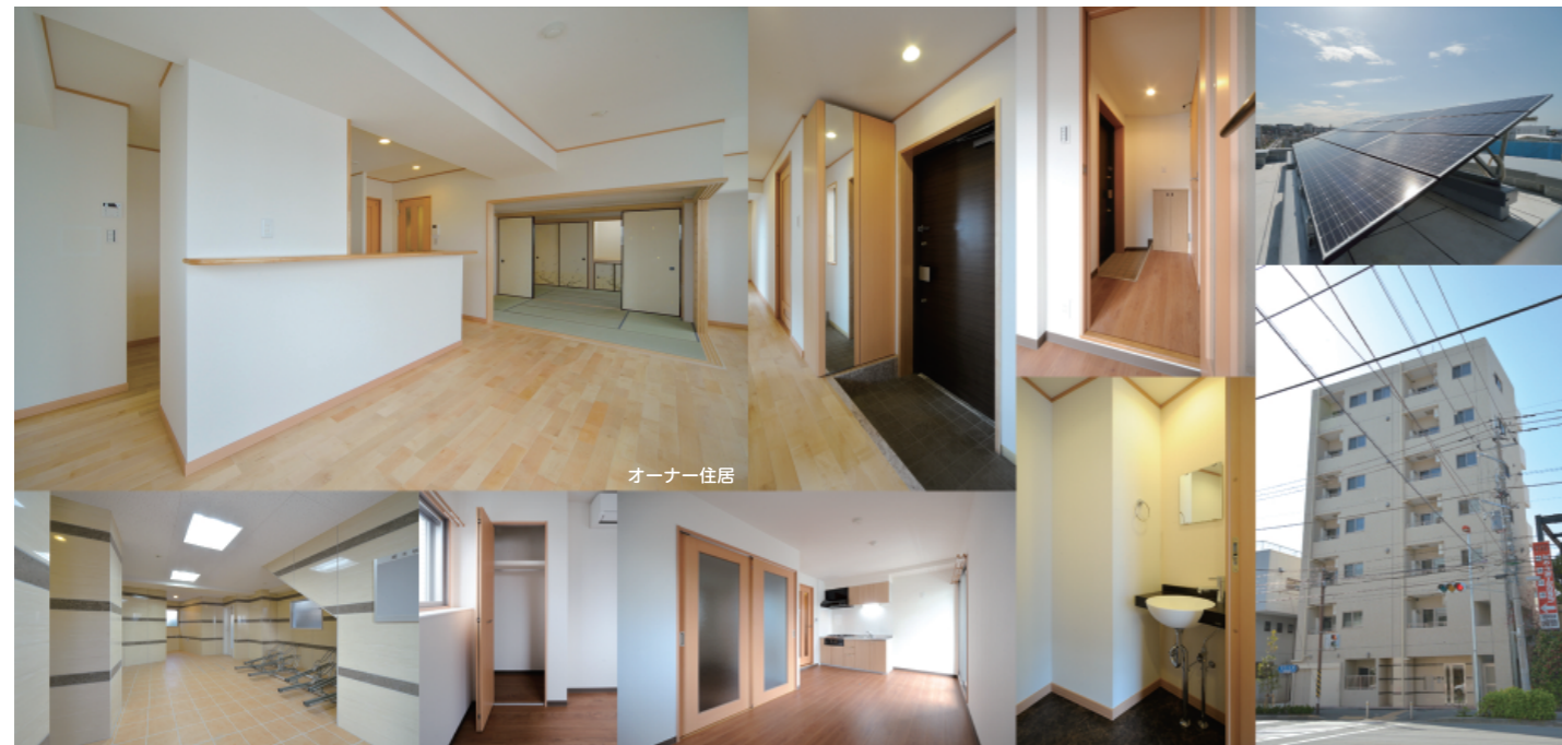
【概要】バストラルMK（2013年3月完成） | 所在地：中原区木月二丁目 | 構造：鉄筋コンクリート造 | 建築面積：106.89㎡ | 延床面積：619.64㎡