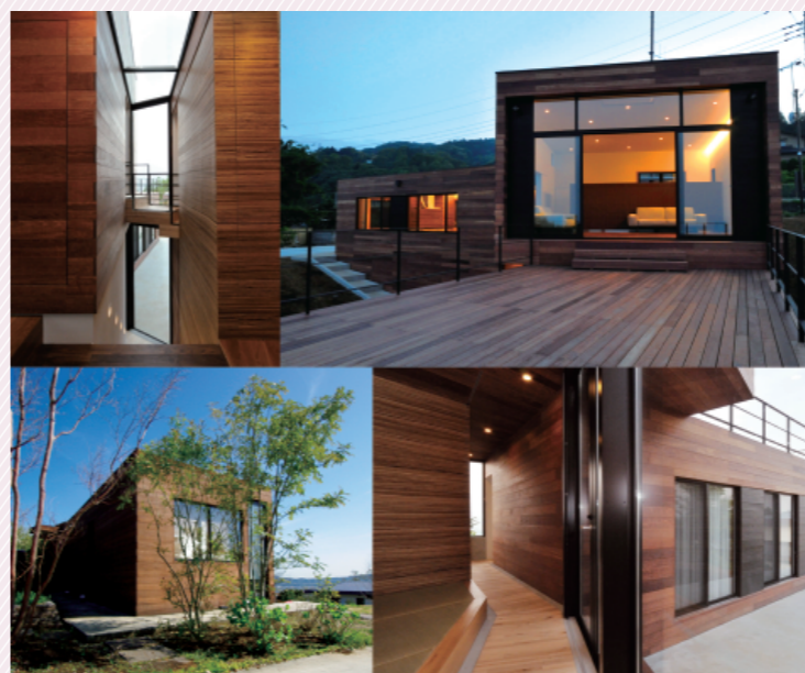
2012年 ホームリサーチ外観賞 受賞